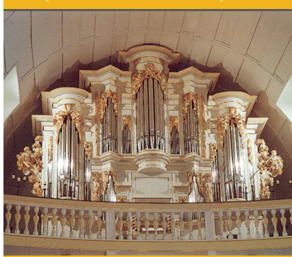
Wanderorgel der J.-S.-Bach-Kirche