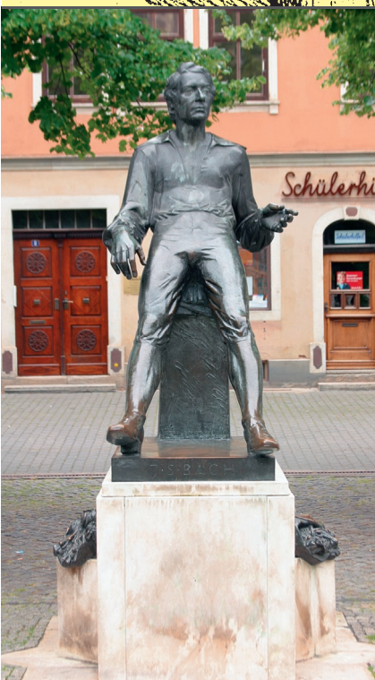
Bachdenkmal auf dem Markt