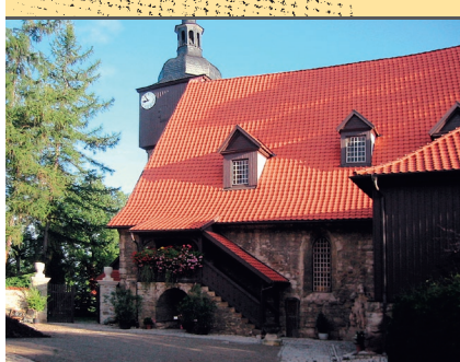
St. Bartholomäus-Kirche, Dornheim (Trau Kirche von J. S. Bach)