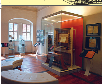
Ausstellung „Bach in Arnstadt“ im „Haus zum Palmbaum“