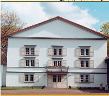
Theater im Schlossgarten