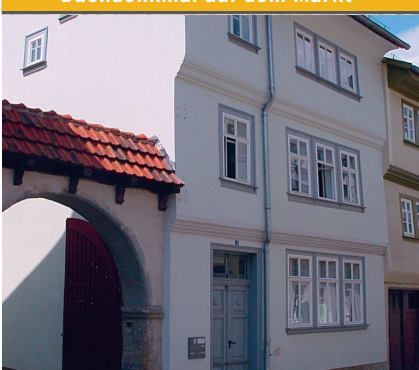
Bachhaus in der Kohlgasse