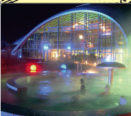
Toskana Thermo Bad Sulza