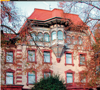
Hotel „Krone“ am Bahnhof