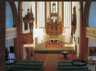
Kaufmannskirche (die Erfurter Bachkirche)