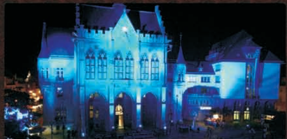
Rathaus mit Festsaal