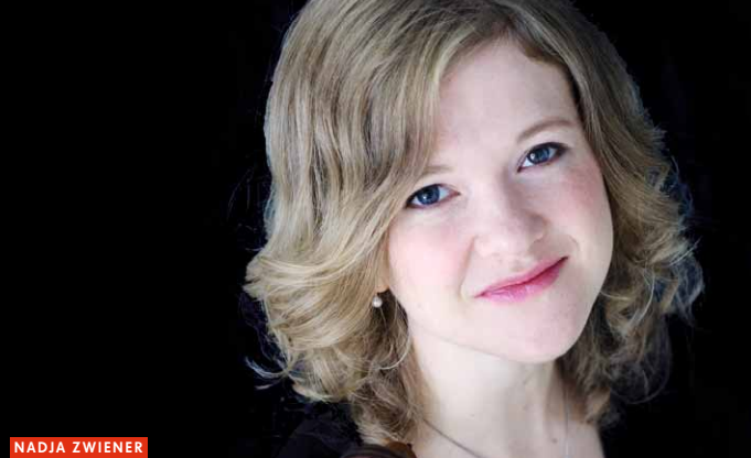
NADJA ZWIENER FOTO AGENTUR