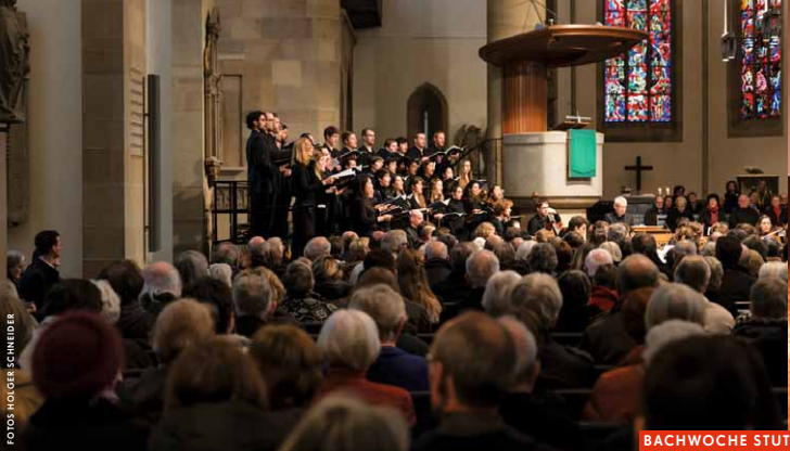
BACHWOCHE STUTTART 2014