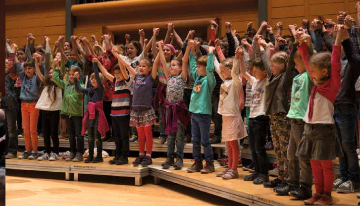
BACHBEWEGT! SINGEN! 2014