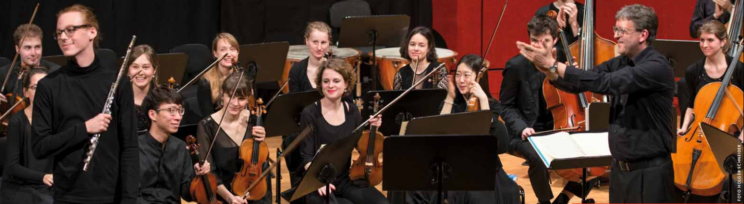
JSB ENSEMBLE & HANS-CHRISTOPH RADEMANN