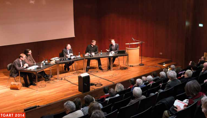
BACHWOCHE STUTTART 2014