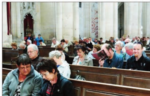
■ Près de deux cents personnes sont venues écouter le concert.