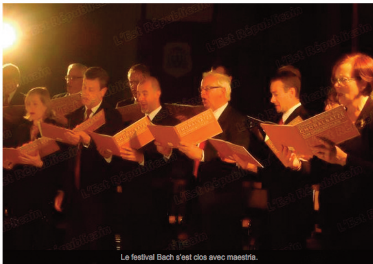
Le festival Bach s'est clos avec maestria.

"O, temps suspend ton vol". La maxime chère à Lamartine semblait appropriée pour qualifier les remarquables instants musicaux vécus par un public nombreux et sous le charme de la dernière du festival Bach.