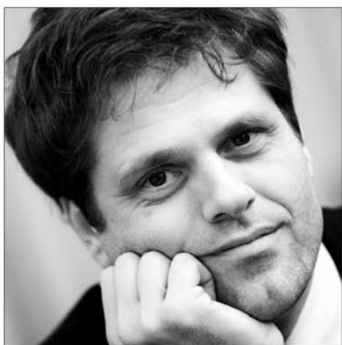
■ Le claveciniste Pieter-Jan Belder.