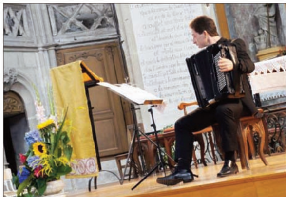
■ Un concert donné en présence de 250 personnes.