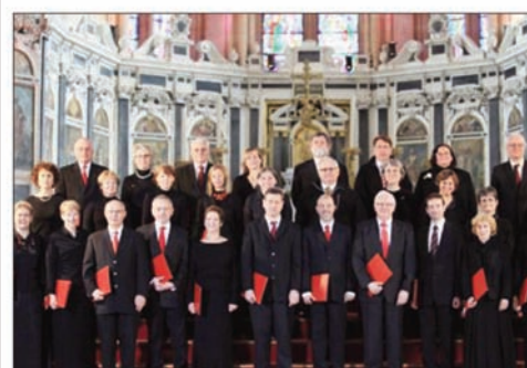
■ L'ensemble choral Variations se produira à deux reprises, demain et samedi.