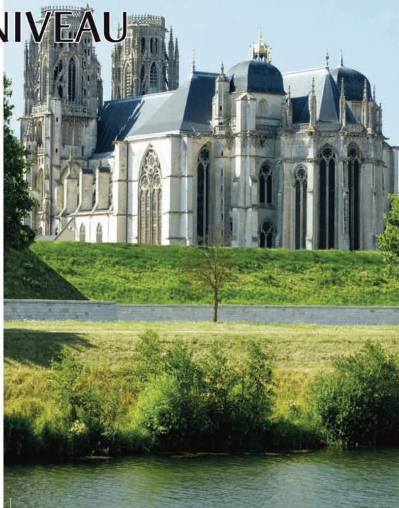
Le Festival Bach de Toul est devenu en trois saisons une manifestation régionale incontournable.

Après 2010 qui avait attiré quelque 900 auditeurs et 2.000 l'an passé, ce nouvel été à l'heure de Bach, proposé en partenariat avec la ville