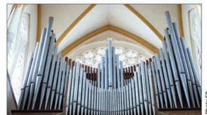
■ Le programme du Festival Bach à Toul est établi. Les concerts mettront en valeur le patrimoine organistique de la ville.