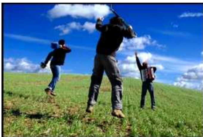
Trio d'en Bas