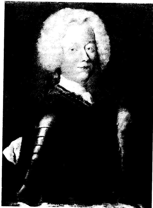
Prince Leopold von Anhalt-Köthen, anon. portrait